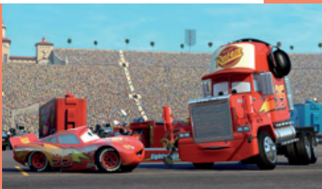
Cars de John Lasseter et Joe Ranft

Rendez-vous les mercredis et dimanches après-midi pour un film suivi d'un débat ou d'une activité et d'un goûter, pour tous les cinéphiles en herbe de 18 mois à 8 ans!