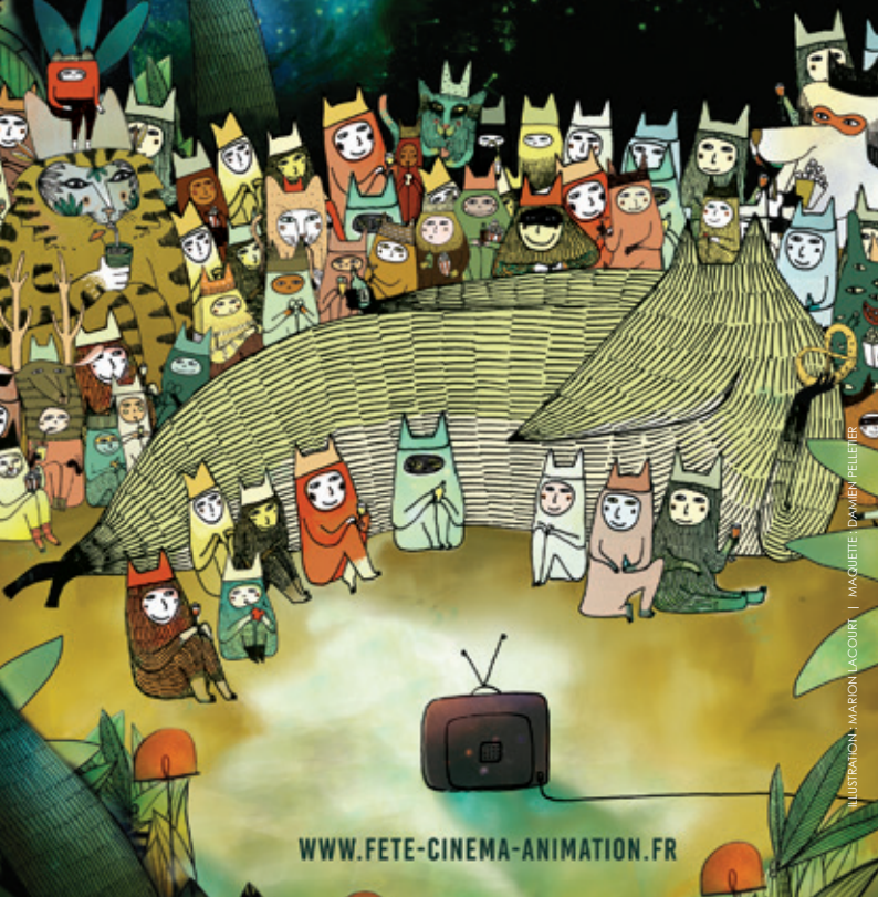
ILLUSTRATION : MARION LACOURRE | MAQUETTE : DAMIEN PELLETIER