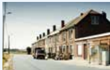
The Natives (Beeverville) © De Wereldvrede