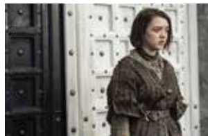
© 2015 Home Box Office, Inc. All rights reserved. HBO ® and all related programs are the property of Home Box Office, Inc