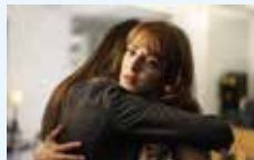
Nouvelle Adresse © Jean Bernier