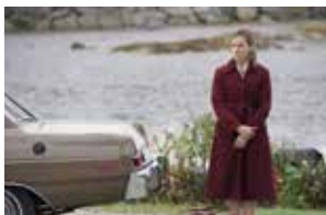
© 2014 Home Box Office, Inc. All rights reserved. HBO ® and all related programs are the property of Home Box Office, Inc.