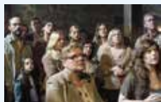
The Refugees © Bambu Producciones