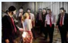
Shades of Guilt © Movie - The Art Of Entertainment 2015