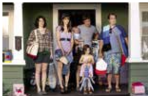
© 2015 Home Box Office, Inc. All rights reserved. HBO ® and all related programs are the property of Home Box Office, Inc.