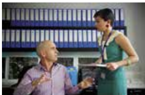
© Utopia TV Pty Ltd. 2014

PRÉSENTÉ PAR L'ÉQUIPE ARTISTIQUE DE SÉRIES MANIA