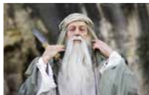
© Assaf Beiser / Natalie Marcus / Michal Efrati