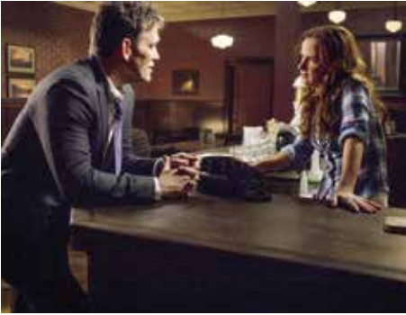
Lane Hentscher © 2014 Fox Broadcasting Co.