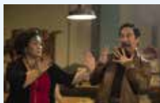
Maximum Choppage