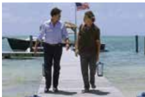
Saeed Adyani © 2014 Netflix, Inc. All rights reserved