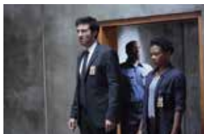
© 2015 Sony Pictures Television Holdings, Inc. All Rights Reserved