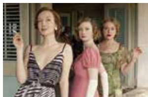
© New Pictures &amp; A&amp;S Media Int.

Du lointain Empire britannique à la campagne anglaise en passant par les intrigues du MI5 à Londres dans les années 1970, la sélection britannique confirme sa capacité à mettre en scène la grande Histoire aussi bien que les enjeux de société les plus contemporains.