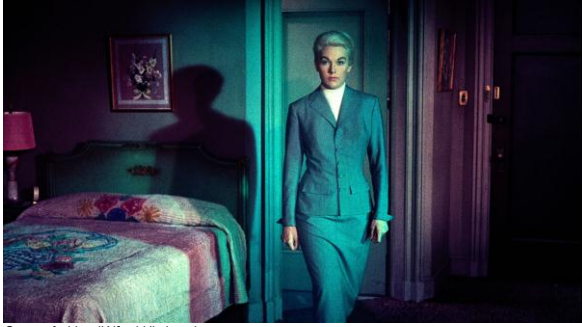
Sueurs froides d'Alfred Hitchcock

Sueurs froides d'Alfred Hitchcock a 60 ans. Ce film somme sur la répétition au cinéma est la porte d'entrée rêvée pour explorer cette figure de style réjouissante.