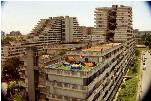
Gomorra de Matteo Garrone

Le Forum des images a toujours réservé une place de choix à ses « portraits de ville » (de Séoul hypnotique à India Express ). Place à Naples, désormais, ville de cinéma, faite pour le cinéma. Certes il y a Rome, qui essaye de tirer toute la couverture à elle. Mais un autre imaginaire du cinéma italien s'élève de Campanie.