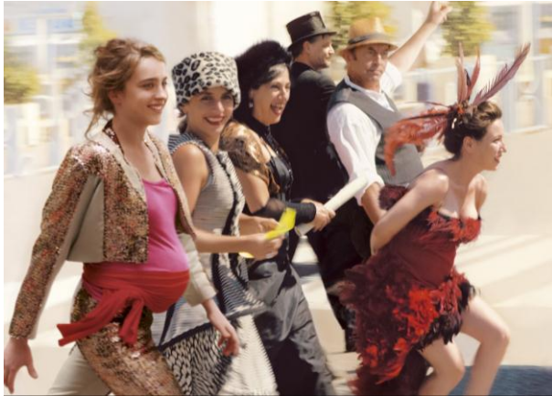
Les Ogres de Léa Fehner

Avoir 30 ans, c'est s'interdire toute nostalgie et regarder l'avenir avec l'aplomb juvénile d'un nouvel adulte. Celui qui entre dans la vraie vie, qui cesse un peu de singer ses aînés pour s'activer à devenir soi-même. Le Forum des images, qui a connu bien des métamorphoses depuis la Vidéotheque de Paris, souffle ses 30 bougies. Plutôt que de se mirer et s'admirer dans le miroir du passé, nous avons choisi d'inviter à cette fête 30 cinéastes qui ont compté pour nous ou pour qui, qui sait ?, nous avons compté. 30 cinéastes et deux acteurs, qui seront les visages de cet anniversaire : Adèle Haenel et Vincent Lacoste, deux artistes pour qui 30 ans, c'est encore demain.