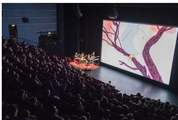
Festival Tout-Petits Cinéma

Du 23 février au 10 mars 2019 – 12 e édition