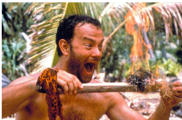
Seul au monde de Robert Zemeckis

À l'occasion du tricentenaire de la publication du roman "Robinson Crusoé" de Daniel Defoe (1719), un voyage cinématographique dans les îles où s'échouent tous les Robinson du monde... Isolé de sa civilisation d'origine, généralement sur une île déserte ou inconnue, le héros-Robinson, qu'il soit seul ou en groupe, doit improviser les moyens de sa survie dans un univers souvent inhospitalier. Il existe également des robinsonnades intérieures, où l'on s'exile en soi-même pour mieux se perdre ou se retrouver. Une cinquantaine de films, de tout horizon et de tout genre, pour éclairer ce mythe universel qui résume les interrogations fondamentales de l'homme, son rapport à l'autre, à la nature et à lui-même.