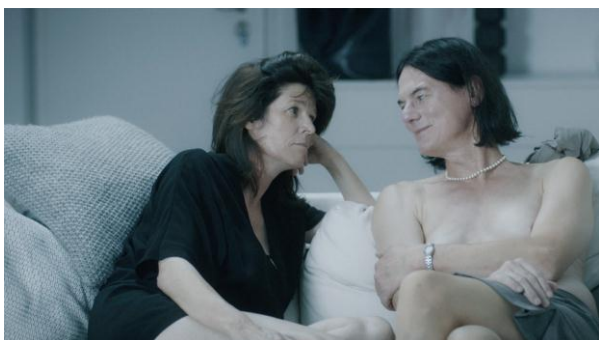
Touch Me Not d'Adina Pintille

Créé à l'automne 2015 avec le soutien de La Scam , 100% doc est l'un des axes forts de la politique de programmation du Forum des images. Sous ce label, qui explore tout le champ des possibles du documentaire, sont proposés des projections tous les mardis, des rencontres avec les cinéastes, des films en avant-première, des séances d'études et des festivals.