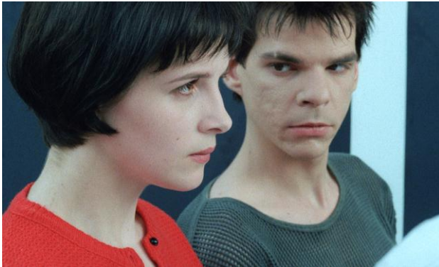
Mauvais sang de Leos Carax

Dans les années 1980, le cinéma français, avec des cinéastes comme Jean-Jacques Beineix, Leos Carax, Claude Miller ou Luc Besson connaît un sursaut formaliste qui se distingue du cinéma dominant. Cette rupture stylistique fut bien vite cataloguée comme une esthétique publicitaire. Or, ce tournant esthétique (et économique) demeure l'une des dernières tentatives de mue du modèle français (tentative restée tentation).