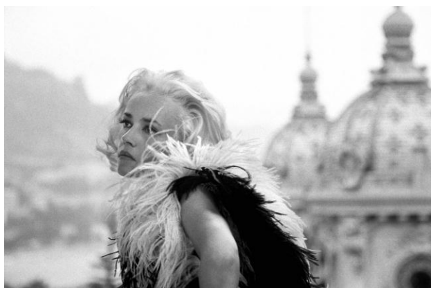
La Baie des Anges de Jacques Demy

Du 1 er au 12 décembre 2018 et du 12 au 16 juin 2019