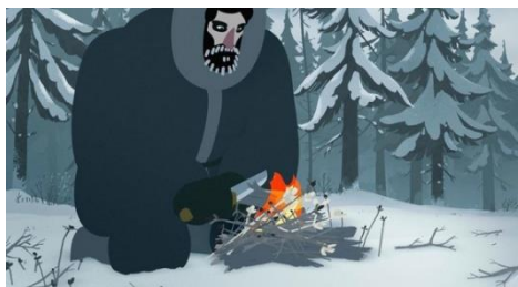
Construire un feu

Fx Goby , jeune réalisateur au parcours international, a réalisé publicités, clips et courts métrages en utilisant différents moyens comme le stop motion, l'animation 2D ou les prises de vue réelles. Auréolé de nombreux prix, l'artiste vient décrire les coulisses, les designs, les briefs et les enjeux de chacun de ses films à partir d'extraits, pour certains inédits.