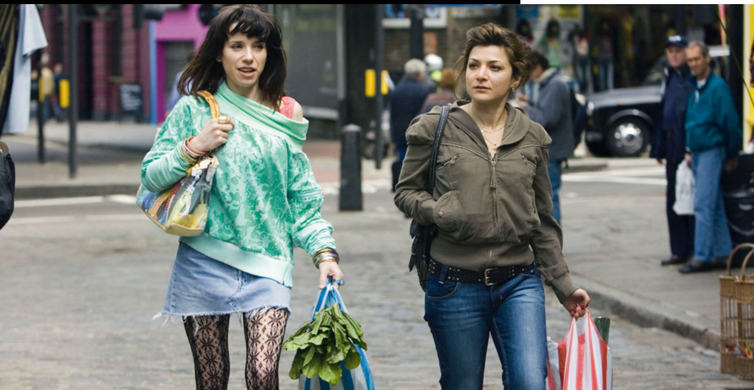
Be Happy de Mike Leigh