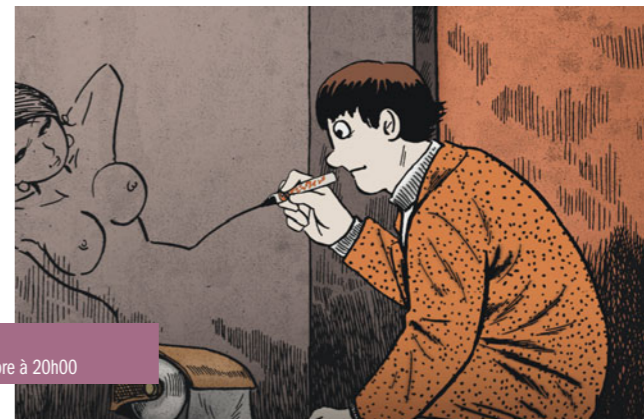
Tatsumi d'Eric Khoo le vendredi 2 décembre à 20h00