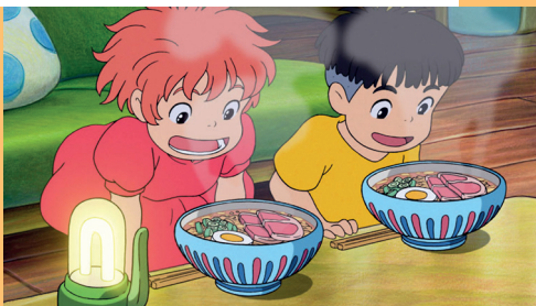
Ponyo sur la falaise de Hayao Miyazaki

Tou-tes les petit-es cinéphiles et apprenti-es gastronomes de 2 à 8 ans sont invité-es, les mercredis et les dimanches après-midi, à venir déguster un bon film, suivi d'un débat ou d'une animation, et d'un goûter!