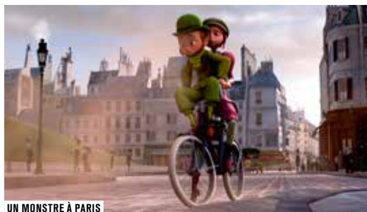
UN MONSTRE À PARIS