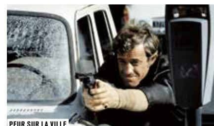
PEUR SUR LA VILLE