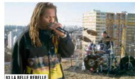
93 LA BELLE REBELLE