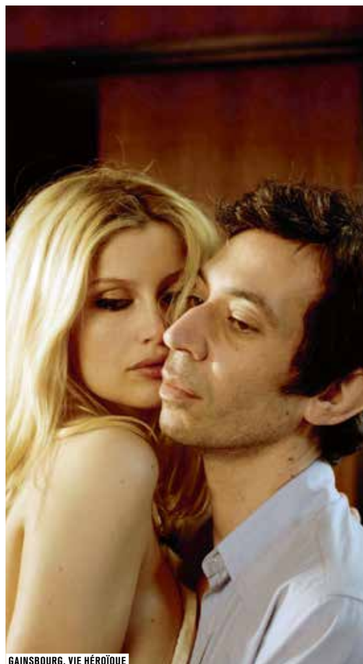
GAINSBORG, VIE HÉROÏQUE