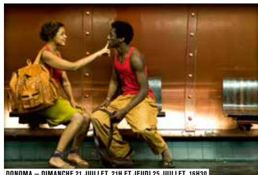
DONOMA – DIMANCHE 21 JUILLET, 21H ET JEUDI 25 JUILLET, 16H30

« Les jours de soleil comme aujourd'hui les arêtes des immeubles déchirent le ciel, les panneaux de verre irradiant. Je vis dans la Ville Nouvelle depuis douze ans et je ne sais pas à quoi elle ressemble. Je ne peux pas non plus la décrire, ne sachant pas où elle commence, finit, la parcourant toujours en voiture. » (1) La mobilité