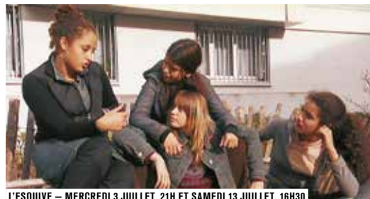
L'ESQUIVE – MERCREDI 3 JUILLET, 21H ET SAMEDI 13 JUILLET, 16H30