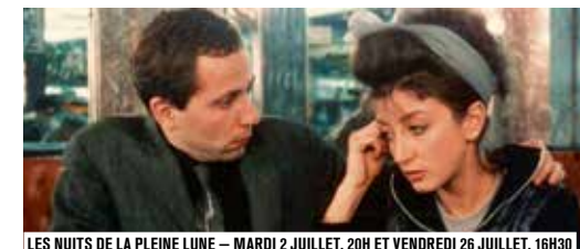
LES NUITS DE LA PLEINE LUNE – MARDI 2 JUILLET, 20H ET VENDREDI 26 JUILLET, 16H30