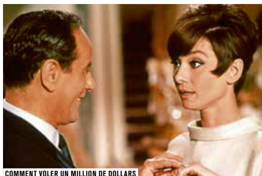
COMMENT VOLER UN MILLION DE DOLLARS