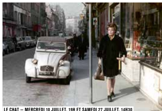
LE CHAT – MERCREDI 10 JUILLET, 19H ET SAMEDI 27 JUILLET, 14H30

Le cinéma a forgé depuis ses débuts les images qui ont construit notre imaginaire de la banlieue. Visions plaisirs ou visions sombres.