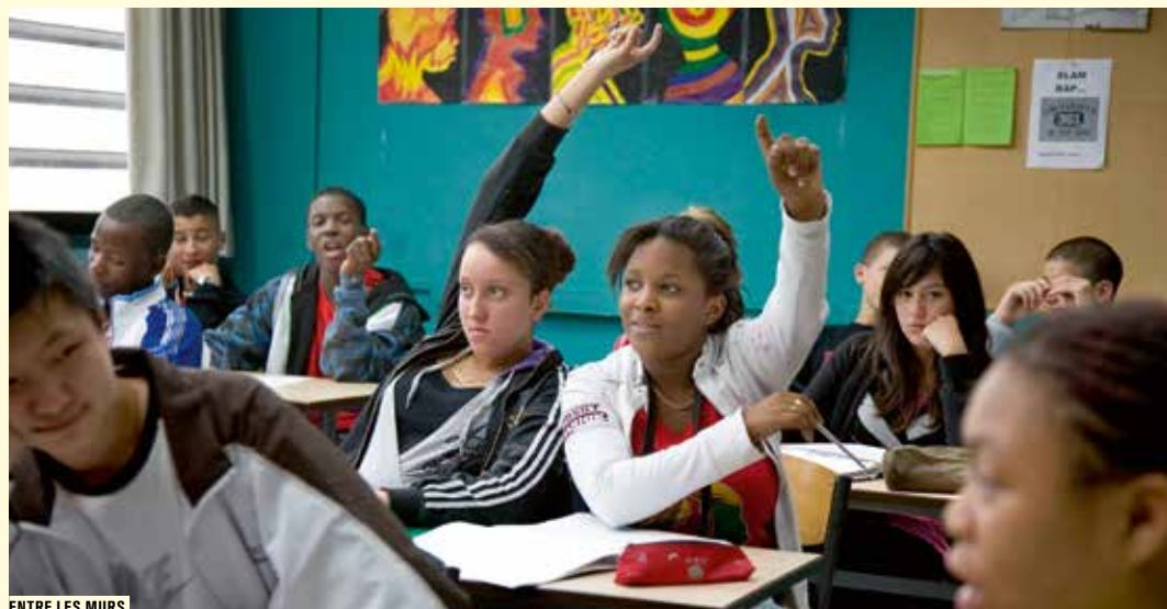
ENTRE LES MURS

Au collège de Saint-Agil, trois élèves ont créé une société secrète qui se réunit la nuit dans la salle de sciences naturelles. L'un d'eux disparaît mystérieusement... Jacques Prévert a signé les dialogues de cette adaptation d'un célèbre roman policier pour la jeunesse, jouée par de grands acteurs.