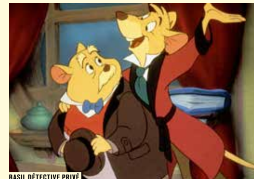
BASIL DÉTECTIVE PRIVÉ