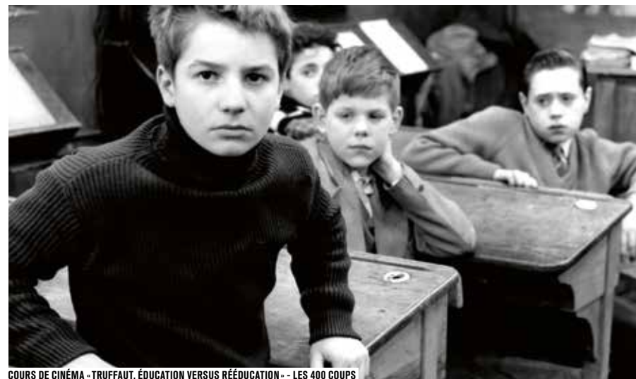
COURS DE CINÉMA - TRUFFAUT, ÉDUCATION VERSUS RÉÉDUCATION - LES 400 COUPS

Le cycle Cas d'école(s) s'explore aussi en ligne, à travers un parcours numérique, sur forumdesimages.fr > le forum numérique > grands formats.