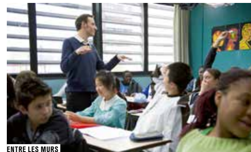
ENTRE LES MURS

Héroïques, les enseignants le sont chez Bertrand Tavernier, entre celui que campe Philippe Torreton dans un Nord sinistré ( Ça commence aujourd'hui ), et celle au bord de la crise de nerfs qu'incarne Nathalie Baye s'interrogeant soudain sur le sens de sa vie et de son métier ( Une semaine de vacances ). Car la difficulté à mener à bien sa mission, les souffrances et l'échec scolaire sont une autre réalité que raconte le cinéma, de l'américain Graine de violence , un des premiers films sur la délinquance, à Entre les murs , palme d'or hexagonale. L'une des plus belles incarnations des enseignants d'aujourd'hui est peut-être la prof de français passionnée de L'Esquive , qui parle à ses élèves du déterminisme social en leur faisant découvrir Marivaux.