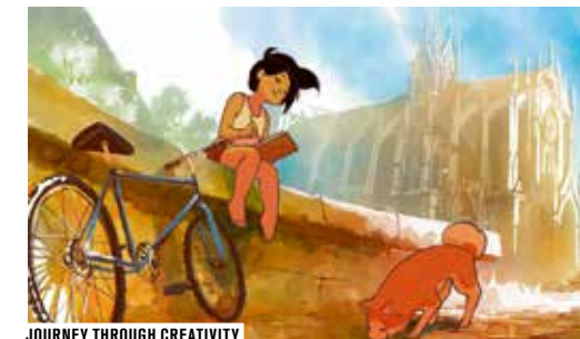
JOURNEY THROUGH CREATIVITY

Snoopy et les Peanuts, Le Chant de la mer, La Tortue rouge ou Zootopie... A priori bien différents, ces films d'animation ont pourtant au moins un point en commun : le logiciel français TVPaint Animation. Puissant outil de dessin et d'animation, on le retrouve dans la plupart des films, séries et publicités animés des deux dernières décennies. Cette conférence est l'occasion d'en savoir plus sur les secrets de l'animation 2D !