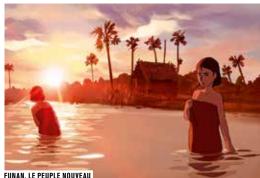
FUNAN, LE PEUPLE NOUVEAU

Funan, le peuple nouveau est le premier long métrage du jeune réalisateur Denis Do. Un film hautement personnel, puisque le réalisateur raconte l'histoire de sa propre mère durant la révolution khmère rouge au Cambodge à la fin des années 1970. Un temps d'échange permettra au public de questionner le réalisateur sur la genèse, les choix artistiques et le déroulement du projet.