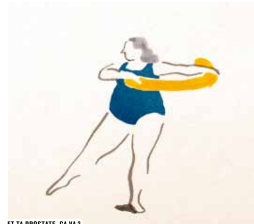
ET TA PROSTATE, ÇA VA ?

Proposée par l'association Les Femmes s'Animent, une sélection de films de femmes aborde les questions d'inégalités et de stéréotypes du genre féminin. Irrévérencieuses et politiquement incorrectes, ces réalisatrices nous donnent à voir, lors d'un programme adulte, des œuvres qui bousculent les codes, chamboulent les genres et se moquent des conventions.