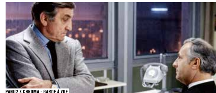
PANIC! X CHROMA - GARDE À VUE

ENTRÉE GRATUITE, RÉSERVATION FORTEMENT RECOMMANDÉE