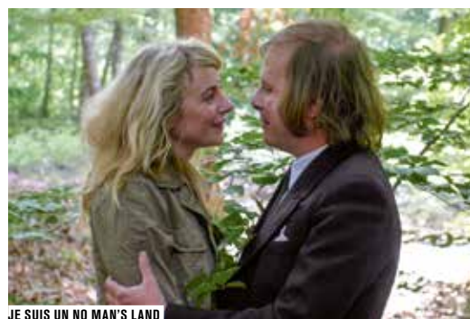
JE SUIS UN NO MAN'S LAND