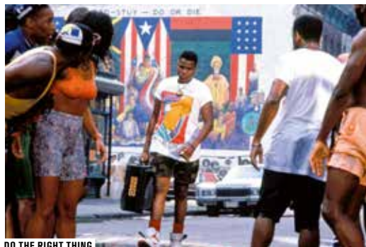
DO THE RIGHT THING

Liés à la vie dans les ghettos, le rap et la culture hip-hop ont aussi gagné les écrans, avec Do The Right Thing en porte-étendard. L'ouverture musicale du film de Spike Lee sur « Fight the Power » de Public Enemy, entre combat de boxe et chorégraphie, est en soi une séquence d'anthologie. D'autres ont fleuri depuis, entre 8 Mile , inspiré de la vie du rappeur Eminem, et le récent Comment c'est loin réalisé et interprété par le français Orelsan. Autant de connexions entre cinéma et musiques urbaines, au programme d'un cours de cinéma. Le générique de fin de Dangereuse sous tous rapports en offre un bel exemple avec l'interprétation somptueuse de « Wild Thing » par Sister Carol devant la caméra de Jonathan Demme.