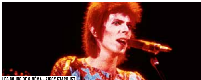
LES COURS DE CINÉMA - ZIGGY STARDUST