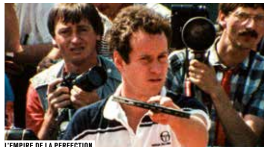
L'EMPIRE DE LA PERFECTION

Le ring pour l'un, le cours de tennis pour l'autre, ont été de fiévreux terrains de jeu entre soi et le monde... Muhammad Ali rencontre John McEnroe ce soir pour un ultime match-retour.