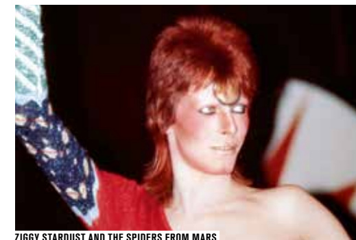
ZIGGY STARDUST AND THE SPIDERS FROM MARS

Au cœur des années 1970, David Bowie incarne à lui seul la vague du rock glam. Son concert historique pour l'album Ziggy Stardust and the Spiders from Mars . L'homme qui venait d'ailleurs exploite habilement l'identité trouble véhiculée par la star du glam, alors que Velvet Goldmine convoque les figures d'Iggy Pop ou de David Bowie. Le genre cinématographique de la comédie musicale s'intéresse très vite au glam rock, des Idoles de Marc'O - opéra-rock glamour et satire du pop-marketing - à Tommy de Ken Russell, de Phantom of the Paradise de Brian de Palma à Cry-Baby de John Waters. Un florilège en 16 films et un cours de cinéma spécial Bowie !