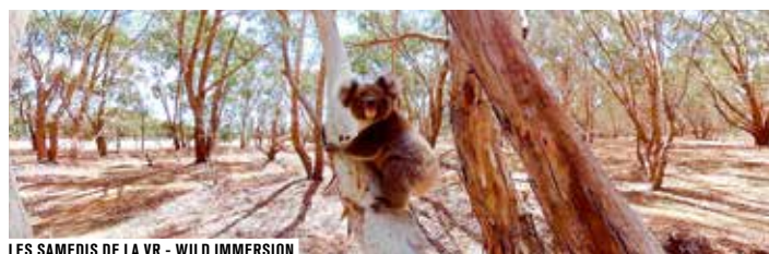
LES SAMEDIS DE LA VR - WILD IMMERSION