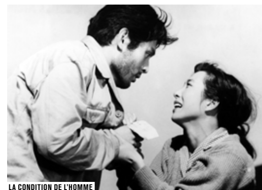
LA CONDITION DE L'HOMME

Œuvre maîtresse du cinéaste japonais Masaki Kobayashi, la fresque La Condition de l'homme , adaptée du roman autobiographique de Junpei Gomikawa, est un film monstre de près de neuf heures, sorti en trois parties en 1959 et 1961. La trilogie suit la vie de Kaji (Tatsuya Nakadai), un jeune intellectuel pacifiste japonais qui tente de survivre à l'époque du Japon fasciste et impérialiste de la Seconde Guerre mondiale. Comme son héros, Kobayashi a subi les