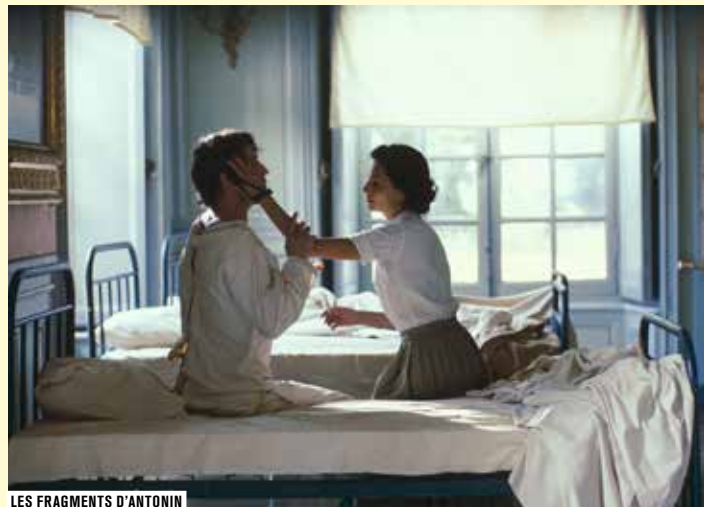
LES FRAGMENTS D'ANTONIN

Une petite couturière attend son mari parti à la guerre. Quand il revient enfin, elle tente de le « réparer »... Film d'animation de fin d'études de l'école des Gobelins.