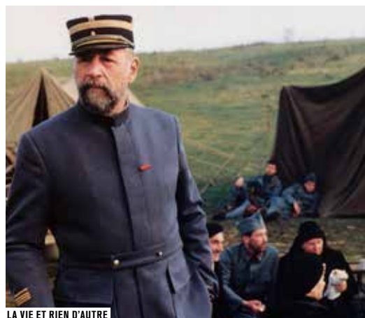
LA VIE ET RIEN D'AUTRE