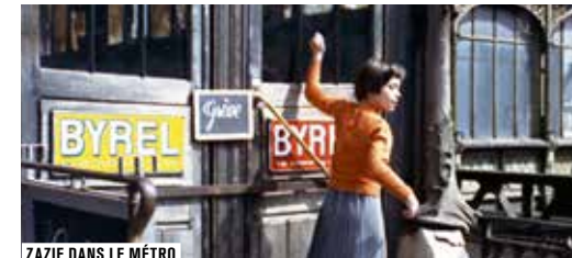
ZAZIE DANS LE MÉTRO

Ils ont les yeux rieurs, les joues rondes et le cheveu noir. Zazie, Bébel et le petit mécano n'ont (presque) rien d'autre en commun, à part faire partie des petites merveilles de la Salle des collections. Toujours autant de films y sont à découvrir, avec de nouveaux programmes thématiques de courts métrages pour les tout-petits... et pour les plus grands!