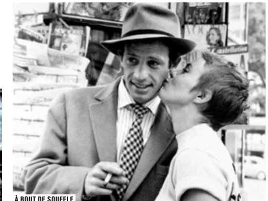
À BOUT DE SOUFFLE

De la parodie d'une émission de télé-réalité ( Vivre avec même si c'est dur ) aux grands classiques qui ont marqué l'histoire du cinéma ( À bout de souffle ), ce sont des films pour tous les goûts qui sont proposés en Salle des collections. À raison d'un film par semaine, vous serez devenu un vrai cinéphile d'ici l'été prochain!