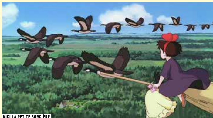
KIKI LA PETITE SORCIÈRE

Le soir d'un vernissage, la compagne d'un artiste découvre le penchant pervers du directeur de la galerie pour les scènes de soumission sexuelle qu'il photographie. Elle devient son modèle, prisonnière de ses fantasmes et de ceux du photographe. Le dernier film, au climat trouble, du cinéaste.