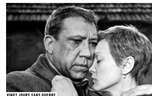
VINGT JOURS SANS GUERRE

Le diptyque d'Alexei Guerman propose une vision nouvelle de la Seconde Guerre mondiale en Union soviétique : les personnages, empêtrés dans leur temporalité, manquent d'horizon et hésitent terriblement sur les décisions à prendre, la guerre semble frapper au hasard, comme une catastrophe naturelle plutôt que des attaques calculées par un ennemi. Guerman va plus loin encore, en opposant, au sein même du second film, la représentation soviétique standard à celle que lui souhaite donner de cet événement indicible.