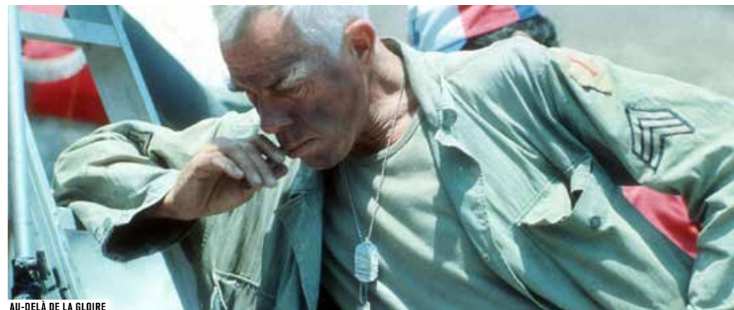
AU-DELÀ DE LA GLOIRE

ENTRÉE LIBRE DANS LA LIMITE DES PLACES DISPONIBLES