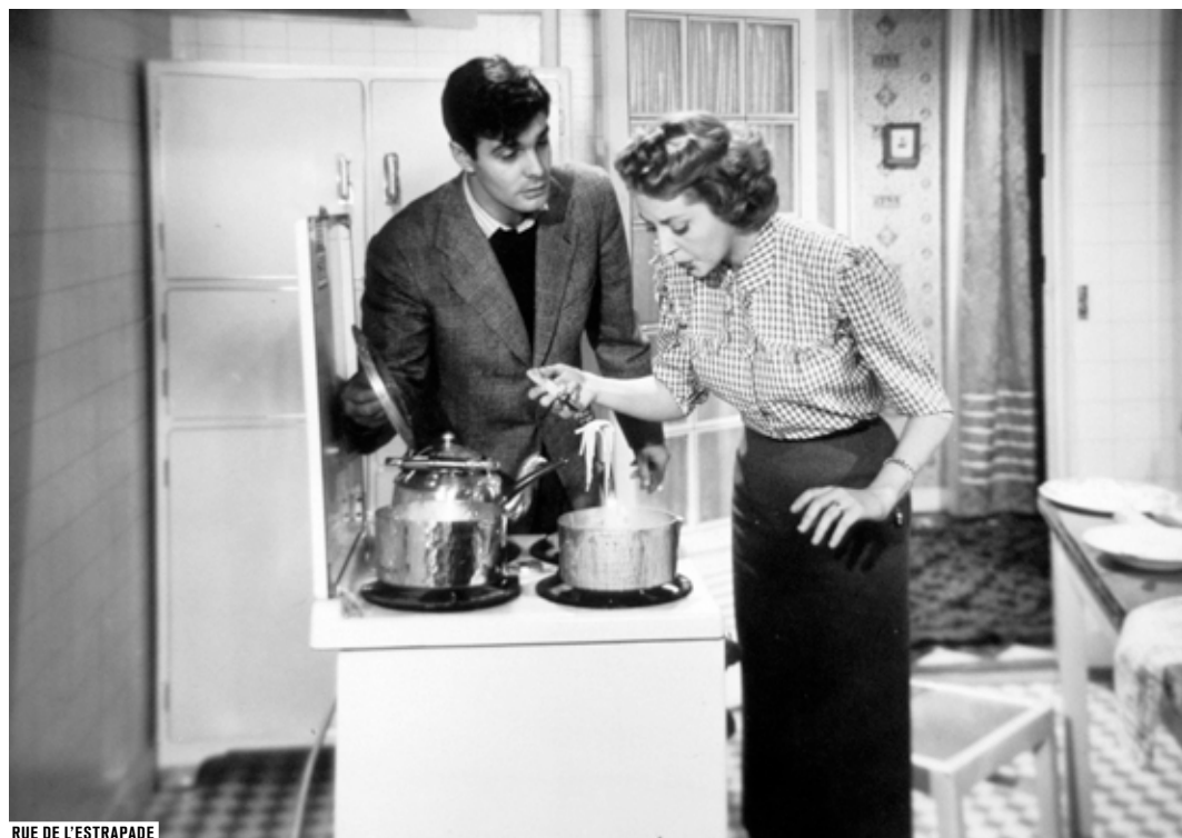
RUE DE L'ESTRAPADE