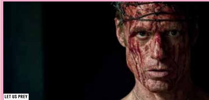
LET US PREY

DÉTAIL DES SÉANCES SUR ETRAANGEFESTIVAL.COM ET FORUMDESIMAGES.FR