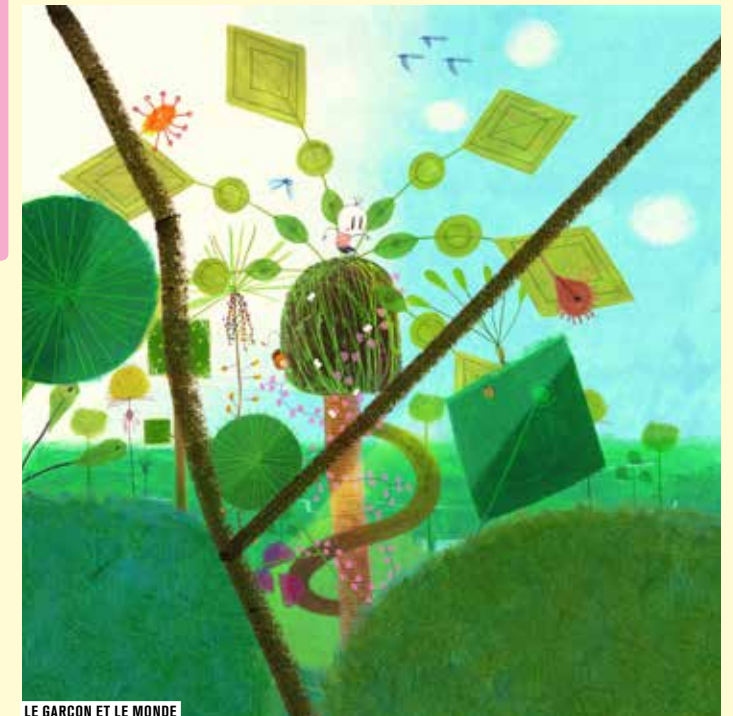
LE GARÇON ET LE MONDE