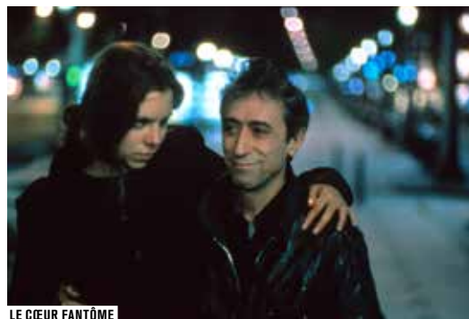
LE CŒUR FANTÔME