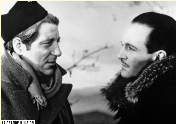
LA GRANDE ILLUSION

ENTRÉE LIBRE DANS LA LIMITE DES PLACES DISPONIBLES