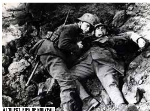
À L'OUEST, RIEN DE NOUVEAU

La transposition au cinéma du chef-d'œuvre d'Erich Maria Remarque « À l'Ouest, rien de nouveau » par Lewis Milestone en 1930 dénonce les horreurs de la Grande Guerre dans cette période charnière de la fin des années 20 - début des années 30 où les sociétés hésitent entre le pacifisme (« la der des ders ») et la montée du nationalisme (la Revanche). Dans cette grosse production du studio Universal, Milestone insiste sur les nouveautés sordides de cette guerre : les pilonnages aériens, la mitrailleuse, et surtout les barrages d'artillerie incessants et dévastateurs (le bombardement du cimetière). Cette projection en avant-première (le film ressort en salles le 5 novembre) propose une version inédite restaurée par Swashbuckler Films. Elle est précédée par le court métrage en pixilation de Norman McLaren, Voisins , expression de ses expériences en Chine et de ses sentiments à l'égard de la guerre