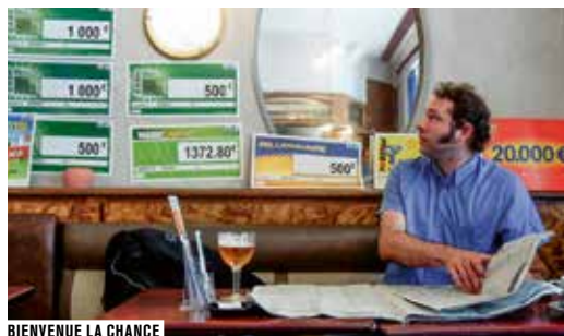
BIENVENUE LA CHANCE

L'humour burlesque, le goût amer de la poésie... C'est cet esprit rouchien qui plane sur le film des jeunes Lautréamont/Hirschi. Cocorico! Monsieur Poulet et Bienvenue la chance : deux fables sur la quête du bonheur, la malchance flamboyante.