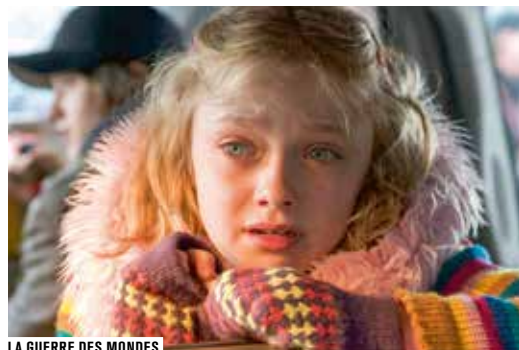
LA GUERRE DES MONDES

Spielberg est le cinéaste parfait pour évoquer cette question du « Home Sweet Home », que l'on retrouve au cœur de toute son œuvre. Maison refuge, rêve impossible (réduit à la vitrine d'un marchand de cuisines équipées dans Munich ), maison à retrouver (pour E.T. ou le cheval de War Horse ), foyer que l'on n'arrive pas à faire tenir debout ( La Guerre des mondes ), maison désertée ( Rencontres du troisième type ), où l'on revient avec le sentiment du devoir accompli (la fin sublime du Pont des espions )... À l'issue de la projection de La Guerre des mondes , le critique Jérôme Momcilovic interroge le fameux « home » américain, son trajet dans l'imaginaire collectif et dans le cinéma hollywoodien – notamment dans celui de Ford, dont on sait l'influence sur Spielberg.