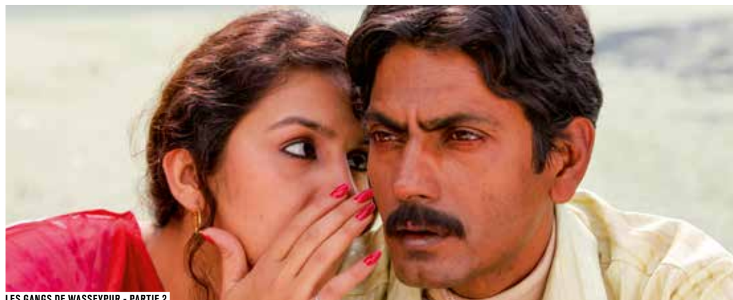
LES GANGS DE WASSEYPUR - PARTIE 2