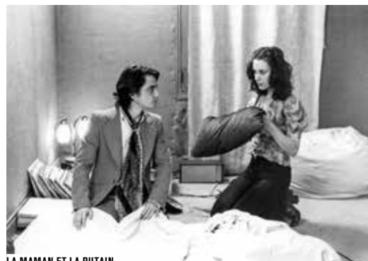
LA MAMAN ET LA PUTAIN

En des temps où l'on se demande comment faire des films, quand l'argent vient à manquer mais que les idées se bousculent néanmoins, il est bon de revenir à la maison. Des cinéastes confirmés profitent des progrès numériques pour filmer coûte que coûte, le plus souvent dans leur propre maison ou appartement. Et des fictions plutôt que des « selfies » documentaires ( Mes séances de lutte de Jacques Doillon).