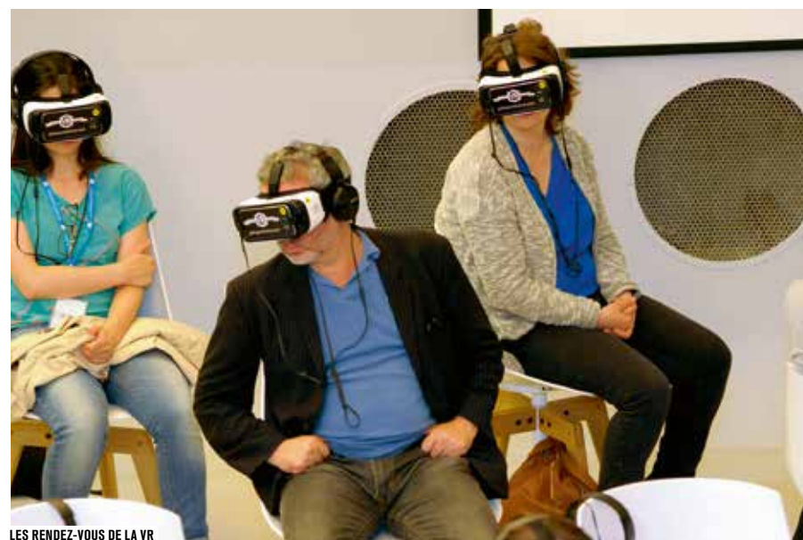
LES RENDEZ-VOUS DE LA VR

Après le succès de la première édition du Paris Virtual Film Festival en juin dernier, le Forum des images dédie un nouveau rendez-vous à la réalité virtuelle et augmentée sous l'angle de la création cinématographique. Chaque mois, une trentaine de masques sont mis à disposition du grand public pour découvrir une programmation internationale de films de cinéma. Des expériences immersives, narratives et spatialisées à part entière, où le spectateur a toute sa place. ▶