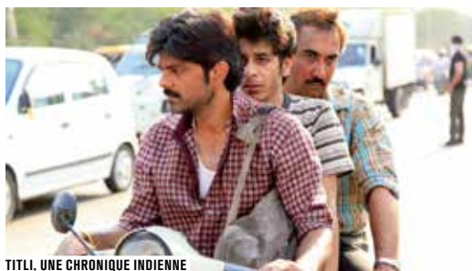
TITLI, UNE CHRONIQUE INDIENNE