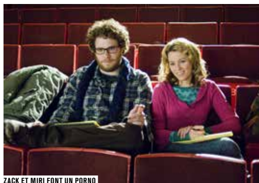
ZACK ET MIRI FONT UN PORNO