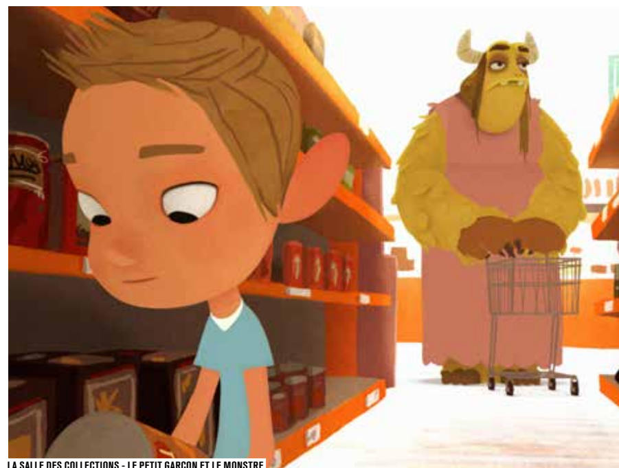
LA SALLE DES COLLECTIONS - LE PETIT GARÇON ET LE MONSTRE

INSCRIPTIONS SUR FORUMDESIMAGES.FR À PARTIR DU 3 MAI