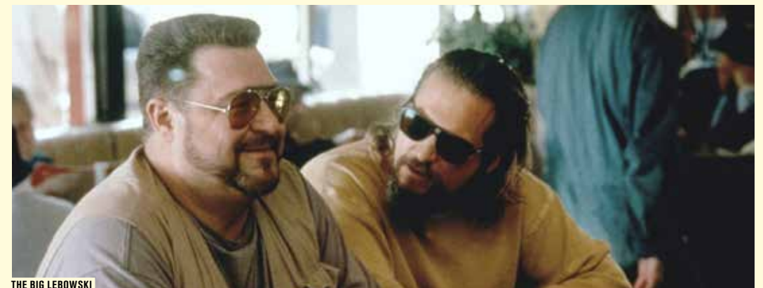
THE BIG LEBOWSKI