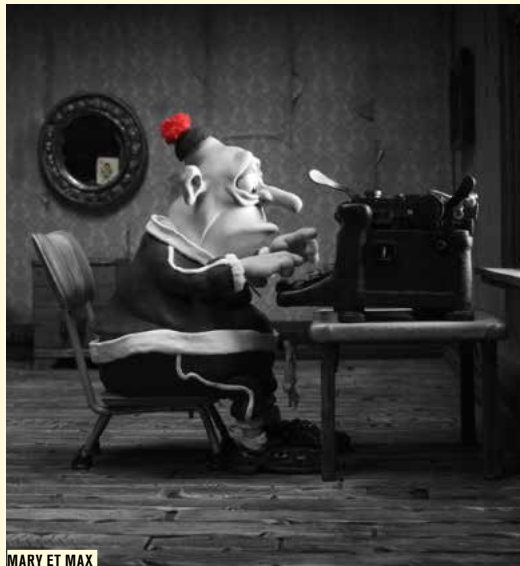
MARY ET MAX

France doc. 1993 n&b 15min (vidéo) Le photographe Edouard Boubat commente, quelques-unes de ses planches contact, en particulier les heureux hasards qui ont présidé à la « bonne photo ».