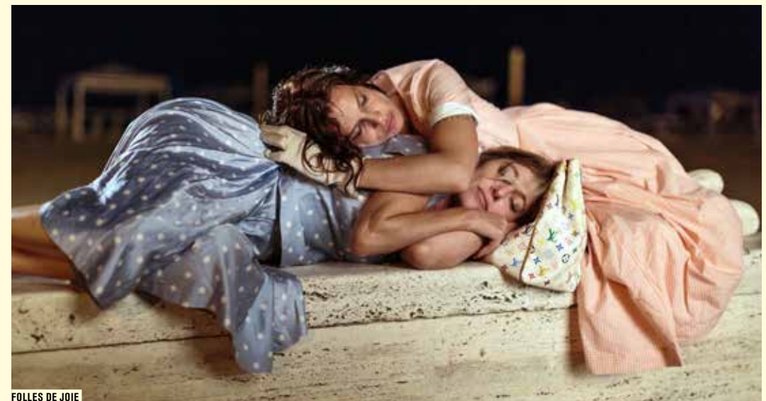
FOLLES DE JOIE