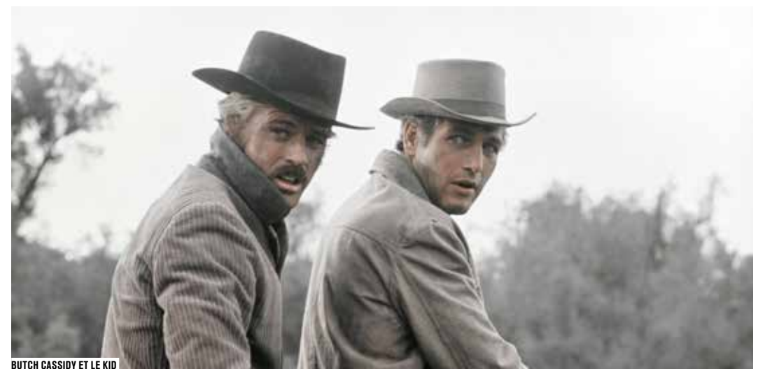
BUTCH CASSIDY ET LE KID