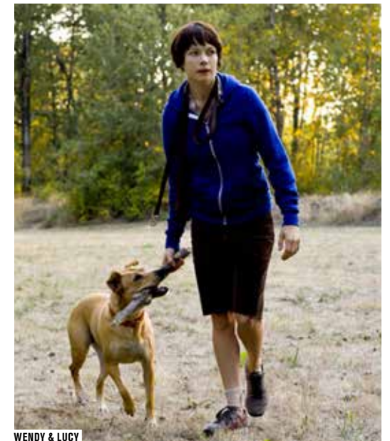
WENDY &amp; LUCY