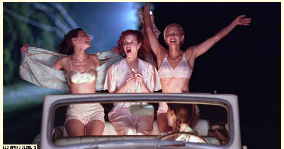
LES DIVINS SECRETS