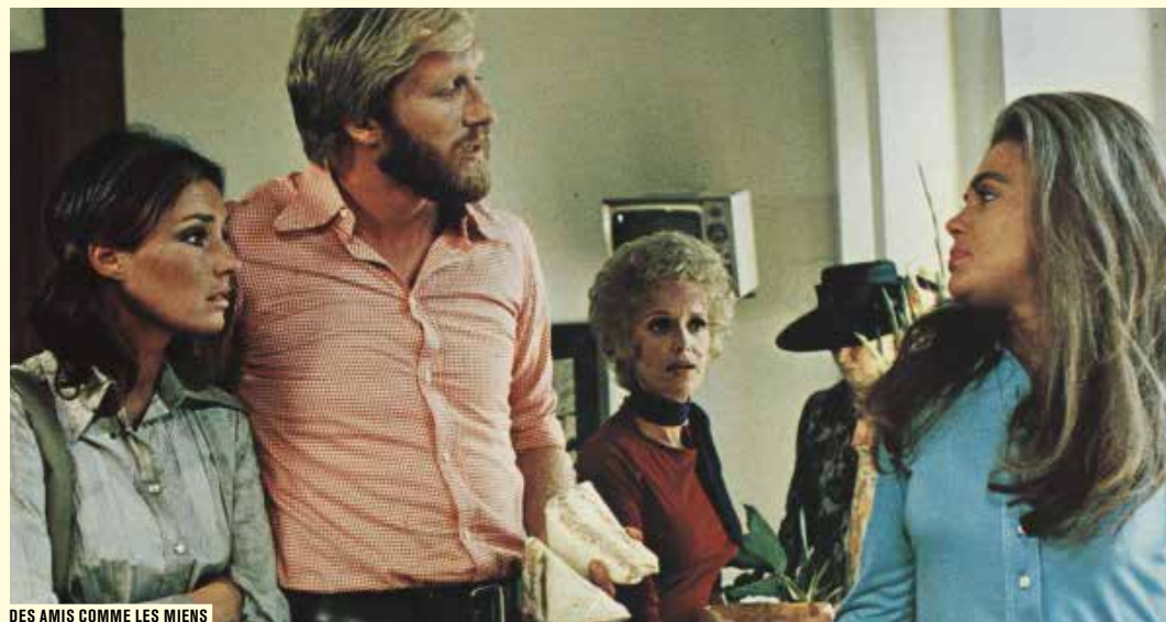
DES AMIS COMME LES MIENS

Charlot adopte un chien errant et les deux compères se tiennent compagnie dans leur infortune. Le chien Mut s'était à ce point attaché à Chaplin qu'il s'était laissé mourir de faim, lorsqu'il fut séparé du comédien parti en voyage. Il fut enterré dans les jardins du studio avec l'épitaphe « Mut, mort le 29 avril, de cœur brisé ».