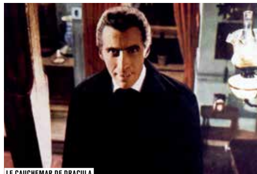
LE CAUCHEMAR DE DRACULA