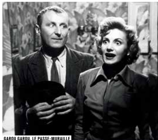
GAROU GAROU, LE PASSE-MURAILLE