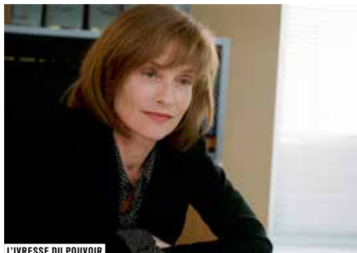
L'IVRESSE DU POUVOIR