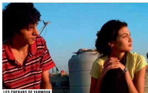
LES CHEBABS DE YARMOUK

Annick Peigné-Giuly, Hélène Coppel - Documentaire sur grand écran