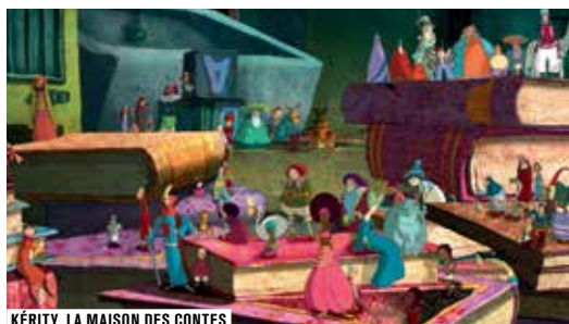
KÉRITY, LA MAISON DES CONTES