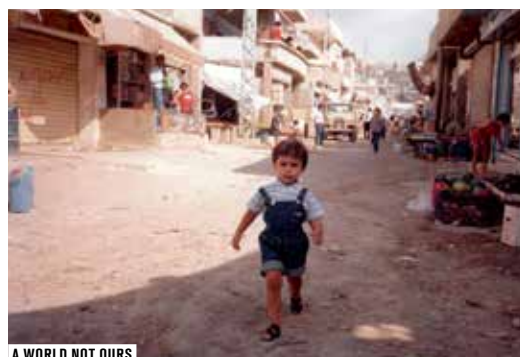
A WORLD NOT OURS