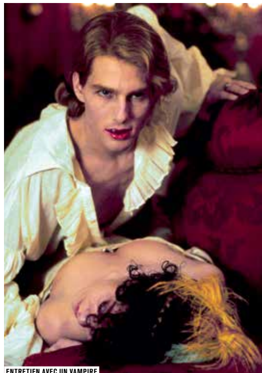
ENTRETIEN AVEC UN VAMPIRE