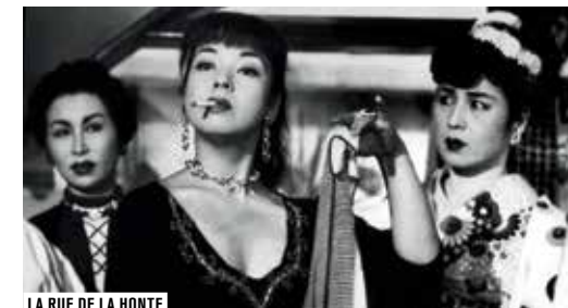
LA RUE DE LA HONTE

Les Cours de cinéma poursuivent leur plongée dans la monstruosité avec une analyse de la figure du vampire et une étude du « cinéma monstre » de Cronenberg. Nouveau cycle oblige, les trois derniers cours du mois sont consacrés à la mise en scène de l'argent. Au programme, Bresson, Chaplin et Mizoguchi.