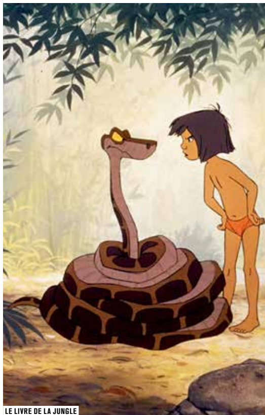
LE LIVRE DE LA JUNGLE