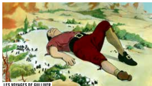
LES VOYAGES DE GULLIVER

TOUTES LES SÉANCES DU MERCREDI APRÈS-MIDI SONT OUVERTES AUX GROUPES (CENTRES DE LOISIRS VILLE DE PARIS, ASSOCIATIONS, CE...), 2,50 € PAR ENFANT, GRATUIT POUR LES ACCOMPAGNEURS. RÉSERVATION OBLIGATOIRE AU 01 44 76 63 48.