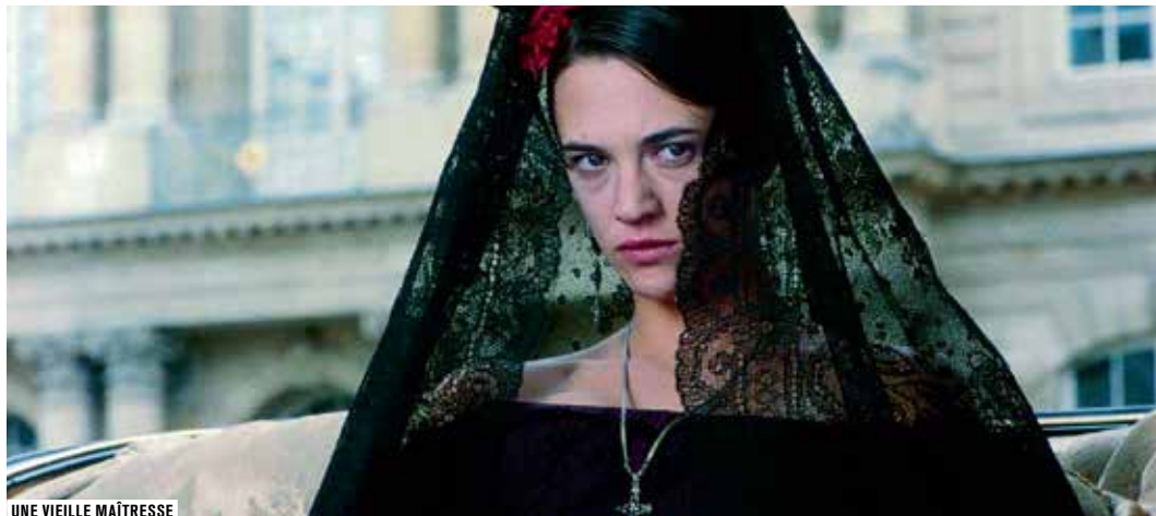
UNE VIEILLE MAÎTRESSE