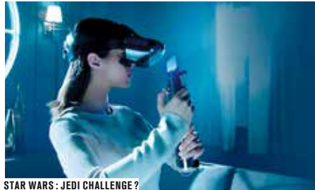
STAR WARS : JEDI CHALLENGE ?