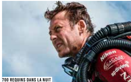
700 REQUINS DANS LA NUIT

NewImages est plus que jamais un lieu de découvertes et d'expérimentations pour mettre les mondes virtuels à la portée de tous ! Le festival débute par une journée dédiée aux groupes scolaires et associatifs, ainsi qu'aux acteurs de la culture, de l'éducation aux images et de la médiation.