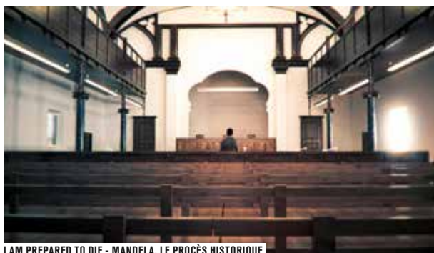
I AM PREPARED TO DIE - MANDELA, LE PROCÈS HISTORIQUE

JEU. 5 AVRIL À 22H15 VEN. 6 AVRIL À 20H45, 21H30 ET 22H15 Voir p.34