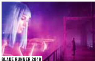
BLADE RUNNER 2049