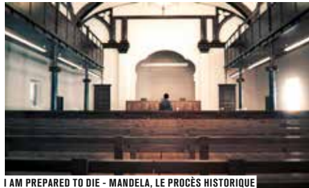
I AM PREPARED TO DIE - MANDELA, LE PROCÈS HISTORIQUE

Sur réservation avec la carte Forum Liberté