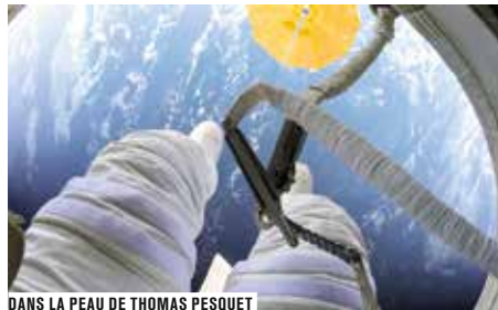
DANS LA PEAU DE THOMAS PESQUET