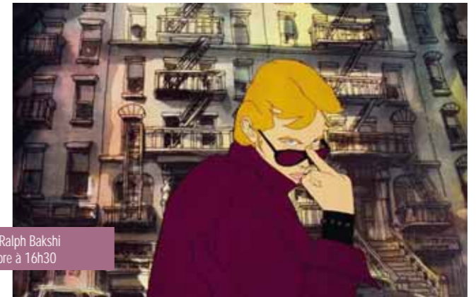
American Pop de Ralph Bakshi le samedi 24 novembre à 16h30