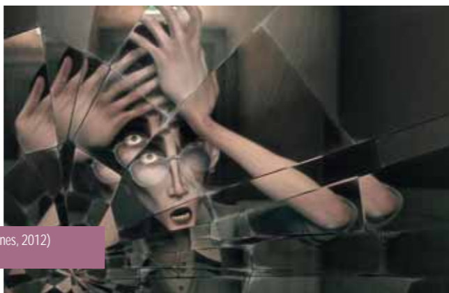
Catharsis (Supinfocom Valenciennes, 2012) Séance Panoramas 2012