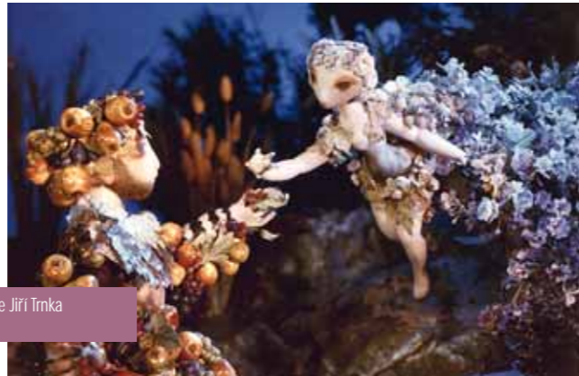
Le Songe d'une nuit d'été de Jiří Trnka le samedi 24 novembre à 14h30