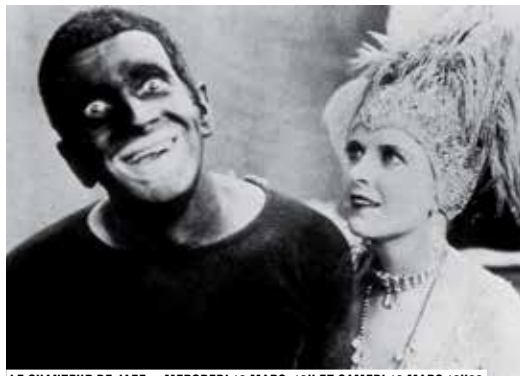
LE CHANTEUR DE JAZZ – MERCREDI 13 MARS, 19H ET SAMEDI 16 MARS, 16H30