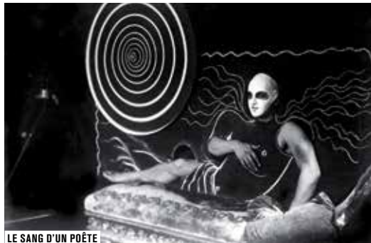
LE SANG D'UN POÈTE