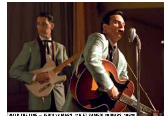
WALK THE LINE – JEUDI 28 MARS, 21H ET SAMEDI 30 MARS, 16H30