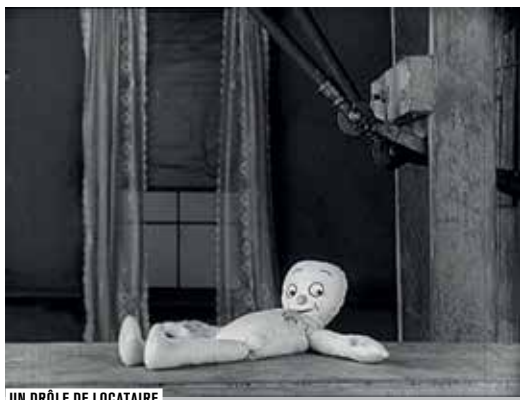
UN DRÔLE DE LOCATAIRE