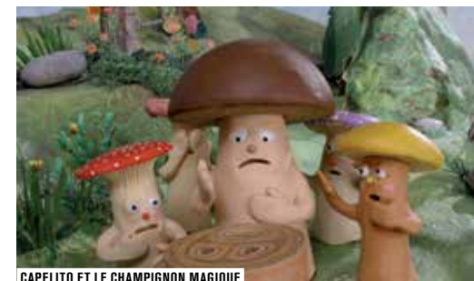
CAPELITO ET LE CHAMPIGNON MAGIQUE

Au programme : Les Chapeaux fous, Le Potier, La Chorale des moutons, L'Arbre coupé, L'Œuf surprise, Les Voleurs de pastèques, La Partie de pêche, Les Trois Poux.