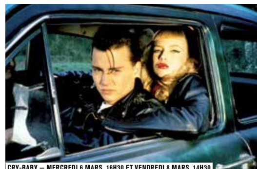
CRY-BABY – MERCREDI 6 MARS, 16H30 ET VENDREDI 8 MARS, 14H30

« Si tu vas à San Francisco, assure-toi d'avoir des fleurs dans les cheveux... », chantait Scott McKenzie l'été 67, « l'été de l'amour » au cours duquel se sont retrouvés, au festival pop de Monterey, les chanteurs issus de la contre-culture américaine. Mouvement hippie, expériences psychédéliques, communautaires et musicales : tout cela se retrouve dans Hair , réalisé par le Tchèque Milos Forman et devenu le symbole du