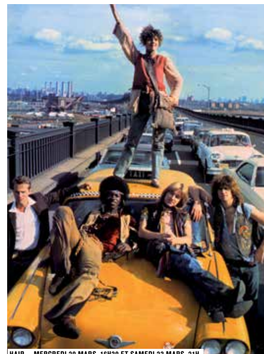
HAIR – MERCREDI 20 MARS, 16H30 ET SAMEDI 23 MARS, 21H

« flower power » américain, ou dans L'une chante l'autre pas d'Agnès Varda. Ces années fleuries voient l'éclosion de concerts gigantesques, dont le cinéma a su rendre l'effervescence à travers de nombreux films ( Monterey , Woodstock , Glastonbury ). D.A. Pennebaker, déjà réalisateur du magnifique Don't Look Back sur la tournée anglaise de Dylan, en fut le pionnier : « Les films de concert n'existaient pas à l'époque, tout était à inventer [...] Rien n'était répété, rien n'était préparé ni orchestré. [...] Si l'Etna se réveille, il faut être là, c'est tout, et trouver une manière de regarder. »