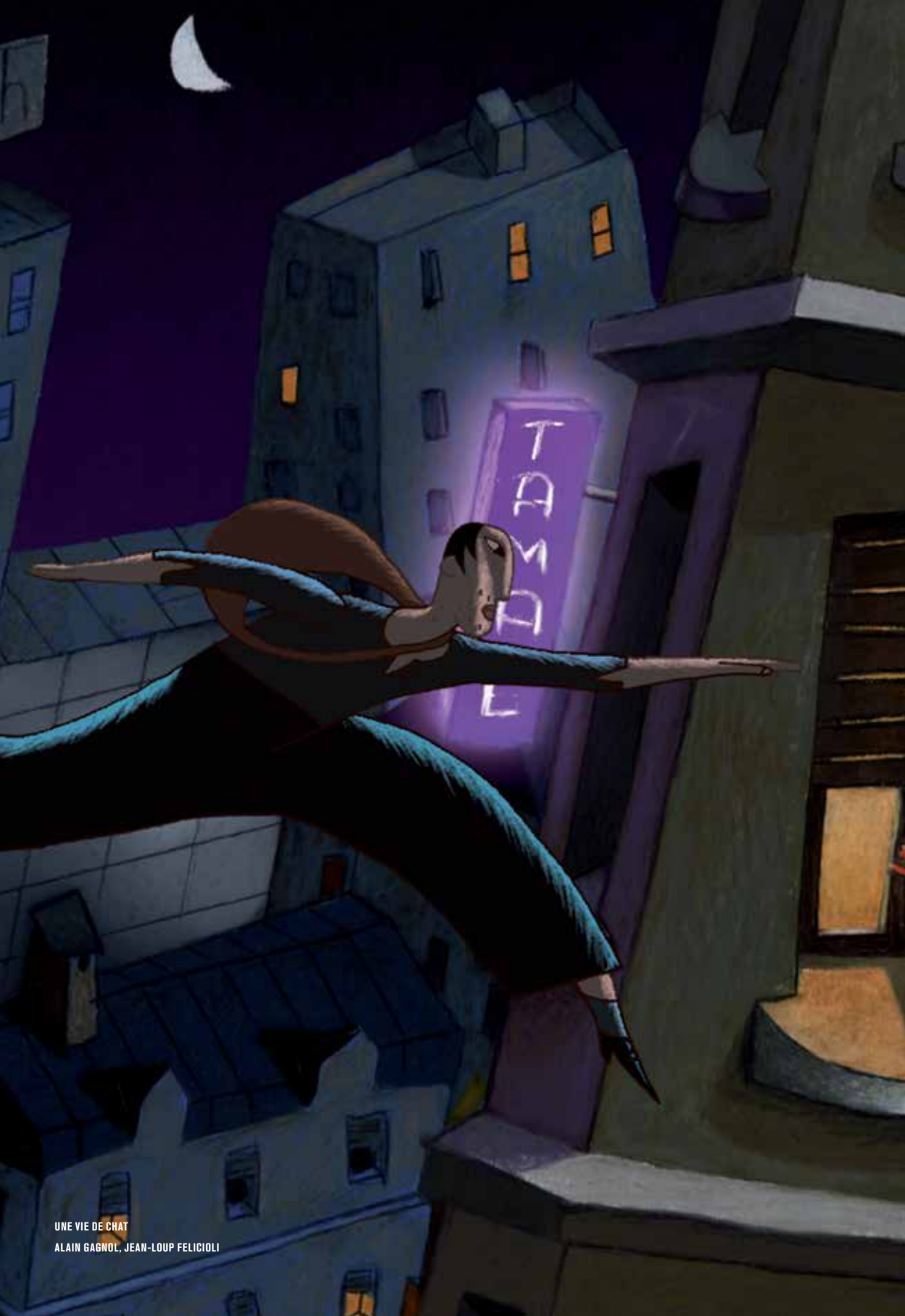
UNE VIE DE CHAT ALAIN GAGNOL, JEAN-LOUP FELICOLI