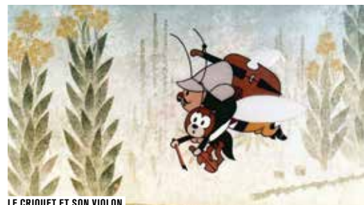
LE CRIQUET ET SON VIOLON

TCHÉC. / ANIM. 1978 COUL. 35MIN (VIDÉO) VOIR P.34