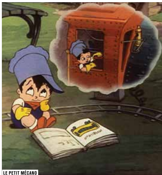
LE PETIT MÉCANO

RETROUVEZ LA LISTE COMPLÈTE DES FILMS POUR ENFANTS EN SALLE DES COLLECTIONS SUR WWW.FORUMDESIMAGES.FR