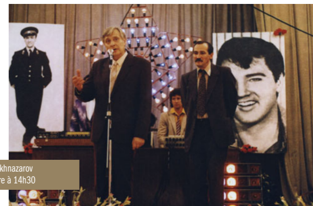
Ville zéro de Karen Chakhnazarov le dimanche 19 septembre à 14h30