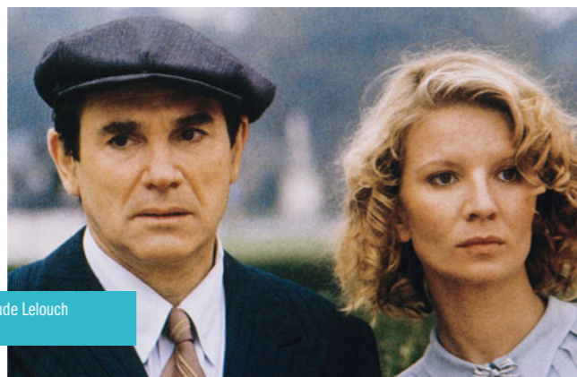
Les Uns et les autres de Claude Lelouch en Salle des collections