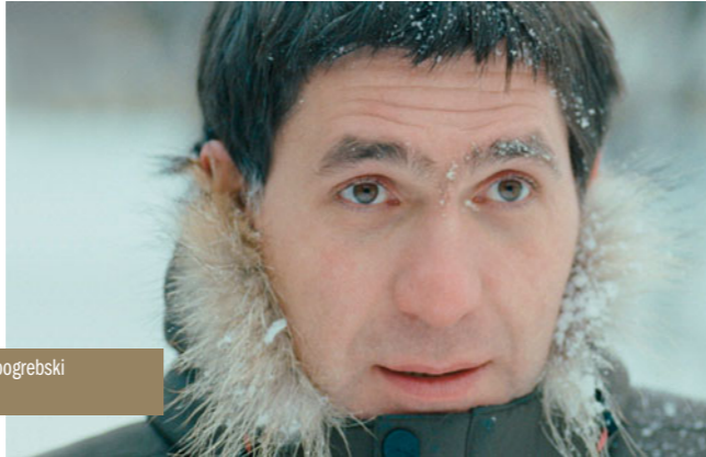
Les Choses simples d'Alexeï Popogrebski le mercredi 15 septembre à 16h30