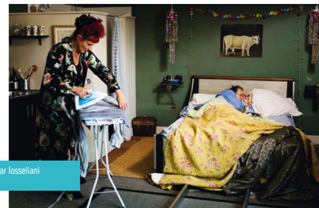
Jardins en automne d'Otar Iosseliani en Salle des collections

Fin septembre, le dernier film d'Otar Iosseliani sort en salles. Son précédent long métrage, Jardins en automne (2006), fait partie de la collection parisienne du Forum des images. Le cinéaste d'origine géorgienne y ausculte son époque et ses travers, captant toujours le drolatique et le loufoque,