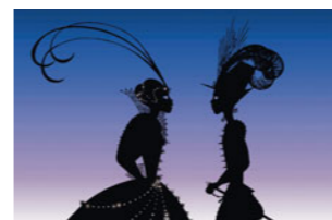
Princes et princesses