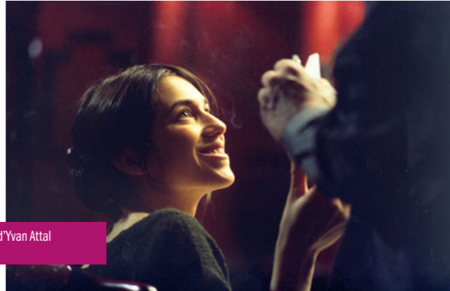
Ma femme est une actrice d'Yvan Attal le mardi 21 septembre à 14h00