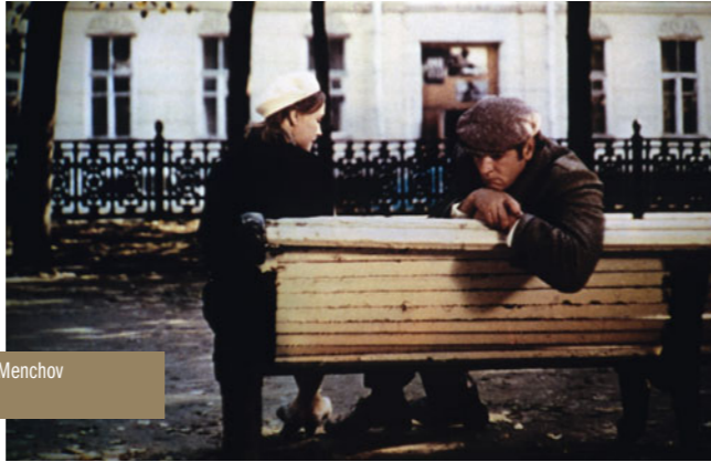
Moscou ne croit pas aux larmes de Vladimir Menchov le dimanche 19 septembre à 21h00