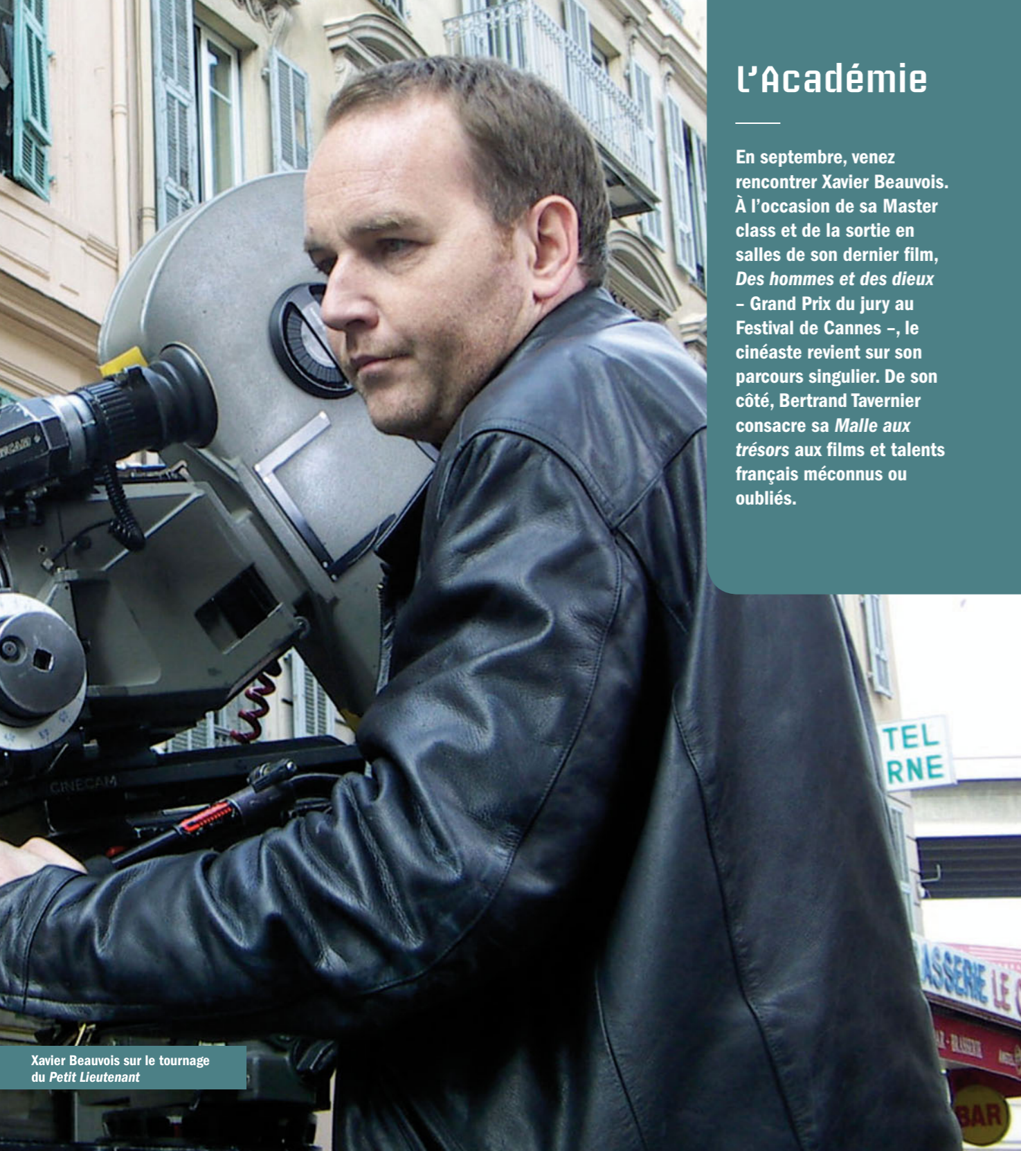
Xavier Beauvois sur le tournage du Petit Lieutenant

En septembre, venez rencontrer Xavier Beauvois. À l'occasion de sa Master class et de la sortie en salles de son dernier film, Des hommes et des dieux – Grand Prix du jury au Festival de Cannes –, le cinéaste revient sur son parcours singulier. De son côté, Bertrand Tavernier consacre sa Malle aux trésors aux films et talents français méconnus ou oubliés.