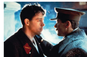
Le Cercle des intimes