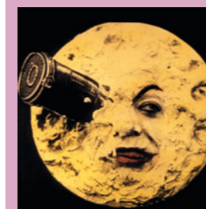
Le Voyage dans la lune