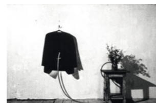
Quiet Week in a House