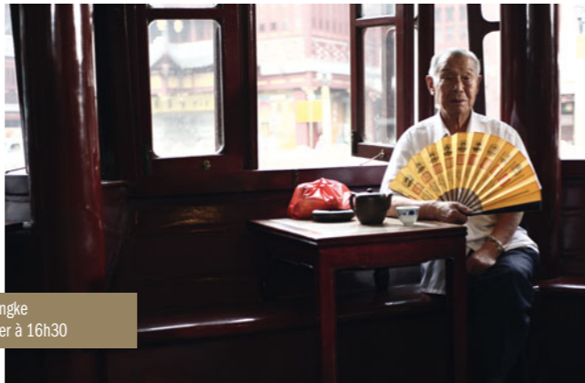
I Wish I Knew, histoires de Shanghai de Jia Zhangke le vendredi 11 janvier à 21h00 et le dimanche 13 janvier à 16h30