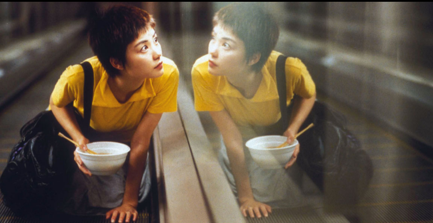
Chungking Express de Wong Kar-wai

Cycle DE PÉRIN À TAIPEI 1000 visages de la Chine [première partie]