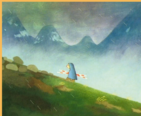
Haut pays des neiges

Avec plus de 150 films pour les petits curieux et de nombreux ciné-jeux multimédias, la Salle des collections est une véritable caverne d'Ali Baba pour les enfants ! Des moments de cinéma à partager en famille chaque après-midi. Entrée libre avec un billet Après-midi des enfants .