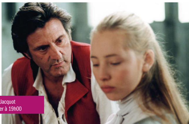
Sade de Benoît Jacquot le mardi 29 janvier à 19h00