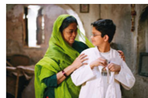
Le Petit peintre du Rajasthan