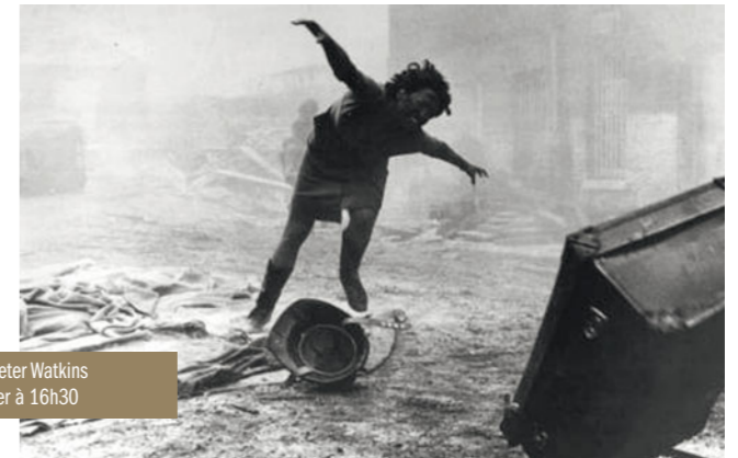
La Bombe de Peter Watkins le samedi 5 janvier à 16h30

Un film de série B, attaqué au moyen de bactéries puis chauffé au moment de sa liquéfaction : à travers le spectacle de sa propre déliquescence, Stadt in Flammen nous rappelle que la décomposition du film est la dernière fascination de l'écran magique.