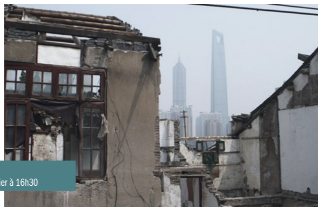
I Wish I Knew de Jia Zhangke le vendredi 11 janvier à 21h00 et le dimanche 13 janvier à 16h30