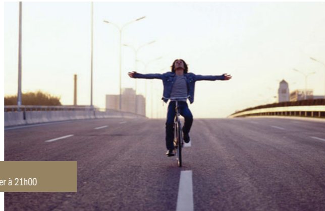
Quitting de Zhang Yang le samedi 12 janvier à 21h00 et le mercredi 16 janvier à 21h00