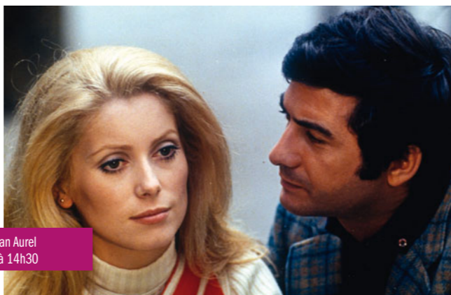
Manon 70 de Jean Aurel le mardi 8 janvier à 14h30