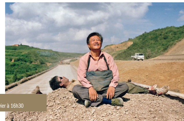
Getting Home de Zhang Yang le jeudi 10 janvier à 21h00 et le jeudi 17 janvier à 16h30