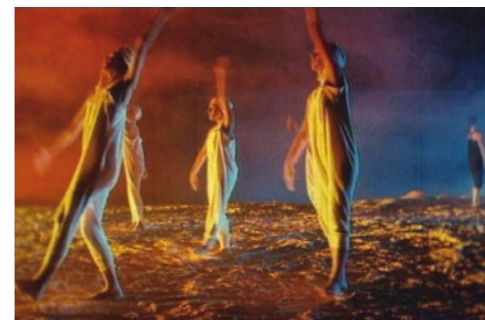
Codex de Philippe Découfflé

Bon plan : Passercollections gratuit pour les moins de 25 ans