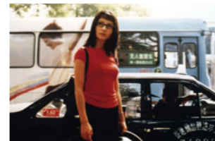
Un taxi à Pékin