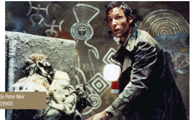
La Dernière Vague de Peter Weir le mercredi 2 janvier à 19h00