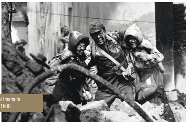
Pluie noire de Shôhei Imamura le samedi 5 janvier à 21h00