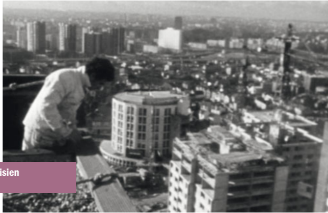
Bagnolet Carrefour Est Parisien le vendredi 11 janvier à 19h00