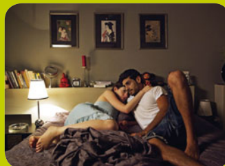
Ta Gordin / Mice © Eitan Bernat