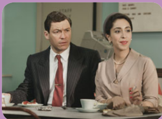
The Hour