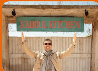
Kaboul Kitchen