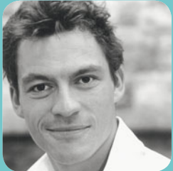
Dominic West

animée par Olivier Joyard (Les Inrockuptibles) précédée à 16h00 des deux premiers épisodes de Boardwalk Empire saison 2 mardi 17 avril à 19h00