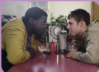
The Fades