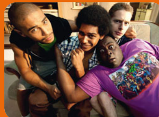
Les Lascars