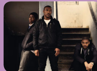
Top Boy