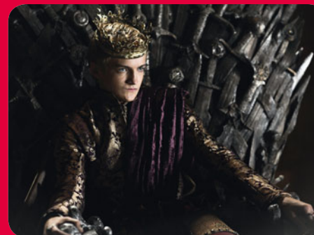
Le Trône de Fer : Game of Thrones © 2012 Home Box Office, Inc. All rights reserved. HBO® and all related programs are the property of Home Box Office, Inc.