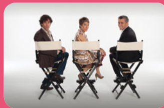
Episodes © Showtime, BBC.

Délurées, douces-amères, excentriques, acidulées ou réalistes, ce sont des comédies bien différentes que vous propose ce marathon. Leurs points communs : être portées par des comédiens hors pair – Matt LeBlanc, Lisa Kudrow, Zoey Deschanel – et nous faire bien rire.