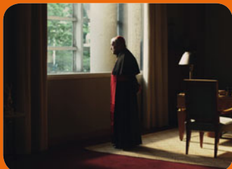
Ainsi soient-ils