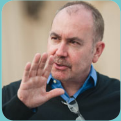
Terence Winter