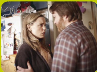
The Slap