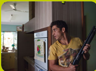
The Straits