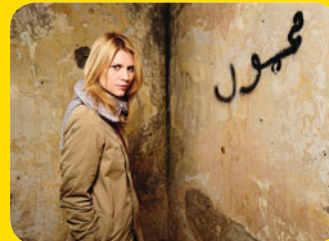
Homeland © 2011 Twentieth Century Fox Film Corporation. All rights reserved.