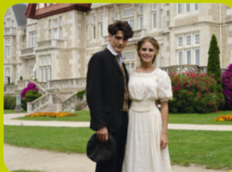
Gran Hotel