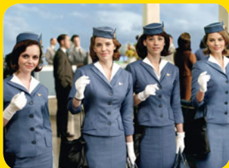
Pan Am