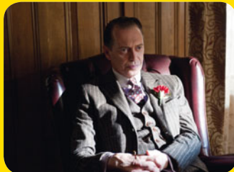
Boardwalk Empire © 2012 Home Box Office, Inc. All rights reserved. HBO® and all related programs are the property of Home Box Office, Inc.