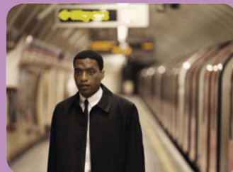
The Shadow Line