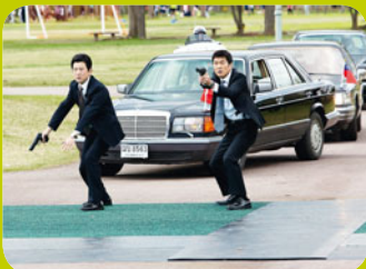
City Hunter