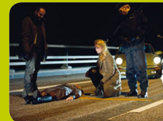
Bron / The Bridge