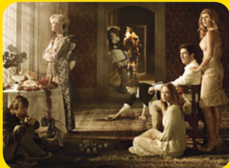
American Horror Story