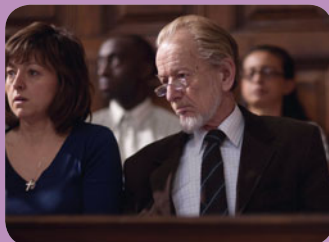
The Jury