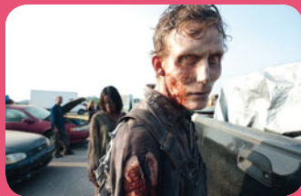
The Walking Dead