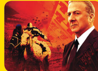
Luck © 2012 Home Box Office, Inc. All rights reserved. HBO® and all related programs are the property of Home Box Office, Inc.