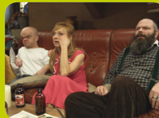
De Ronde