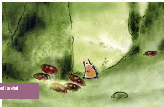
Rentrons chez nous de Behzad Farahat le mardi 23 février à 16h00