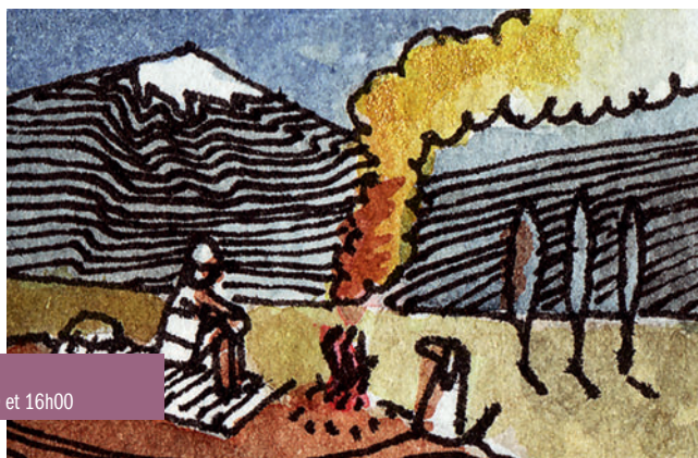
Promenade nocturne le dimanche 28 février à 11h00 et 16h00