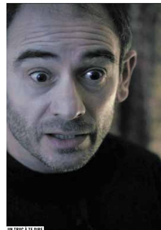
UN TRUC À TE DIRE

Les sélections, en compétition ou hors compétition, proposent un foisonnement de films qui, au gré des thématiques, composent un voyage unique au coeur d'univers les plus inattendus. Plusieurs nouveautés cette année avec entre autres, dans la compétition Paroles de Femmes, un Prix du droit des femmes remis pour la première fois à Paris. Une nouvelle sélection voit également le jour, « Travelling 34 », pour montrer que handicap peut rimer avec vitalité et créativité. Voici donc une 15 e édition qui, à n'en point douter, ne connaît pas la crise.