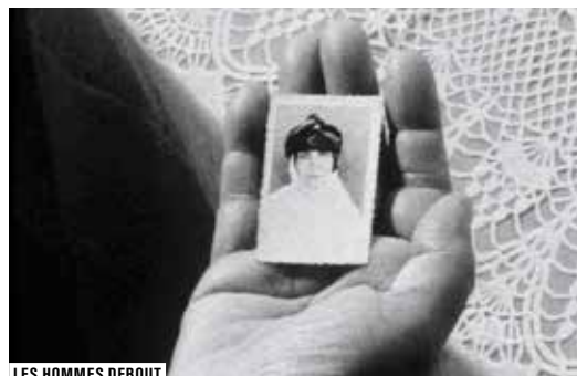
LES HOMMES DEBOUT

EN PARTENARIAT AVEC : CNC / SCAM / COPIE PRIVÉE / RÉGION ÎLE-DE-FRANCE / PROCIREP / MAIRIE DE PARIS / ARTE