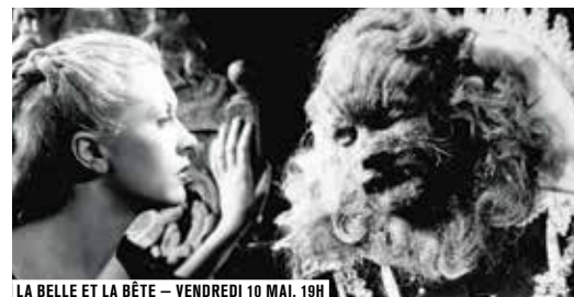
LA BELLE ET LA BÊTE – VENDREDI 10 MAI, 19H

Portrait en douze films des amours monstrueuses, inconnues, étranges, condamnées par la société. Comment s'emparent-elles des personnages, contre toute attente, toute raison, et les mènent-elles dans des univers mystérieux, inavoués et inavouables ? Amour pour le singe (analysé par Frédéric Bas), pour la monstruosité physique ( La Belle et la bête , Possession , Le Soldat dieu ), pour un magnifique cadavre ( Lune froide ) ou un corps « endormi » ( Sleeping Beauty ) ; amour incestueux entre mère et fils ( Santa sangre ), de la victime pour son tortionnaire ( Portier de nuit ) ; pour une poupée gonflable ( Une fiancée pas comme les autres ), ou un vampire ( Nosferatu ) ; ou trio amoureux infernal et cruel ( Balade triste ).