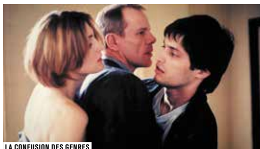
LA CONFUSION DES GENRES