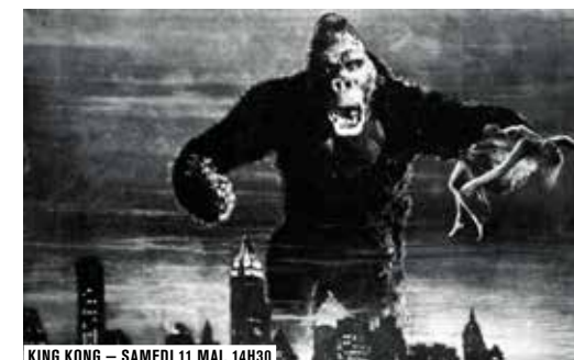
KING KONG – SAMEDI 11 MAI, 14H30

À partir des deux grands mythes du cinéma, Tarzan et King Kong , Frédéric Bas, historien et critique de cinéma, rouvre le dossier de la relation érotique entre la femme et le singe. Une conférence précédée de la projection de King Kong et suivie de celle de Max mon amour .