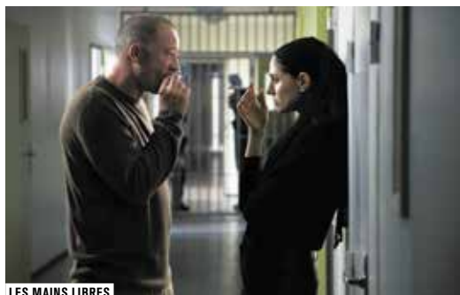
LES MAINS LIBRES