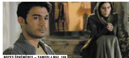
NOCES ÉPHÉMÈRES – SAMEDI 4 MAI, 19H