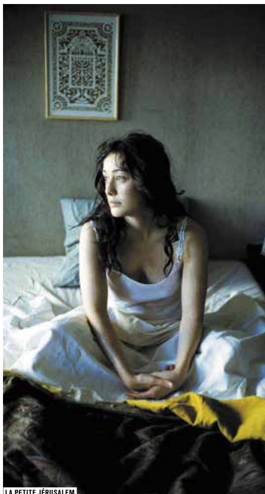
LA PETITE JÉRUSALEM